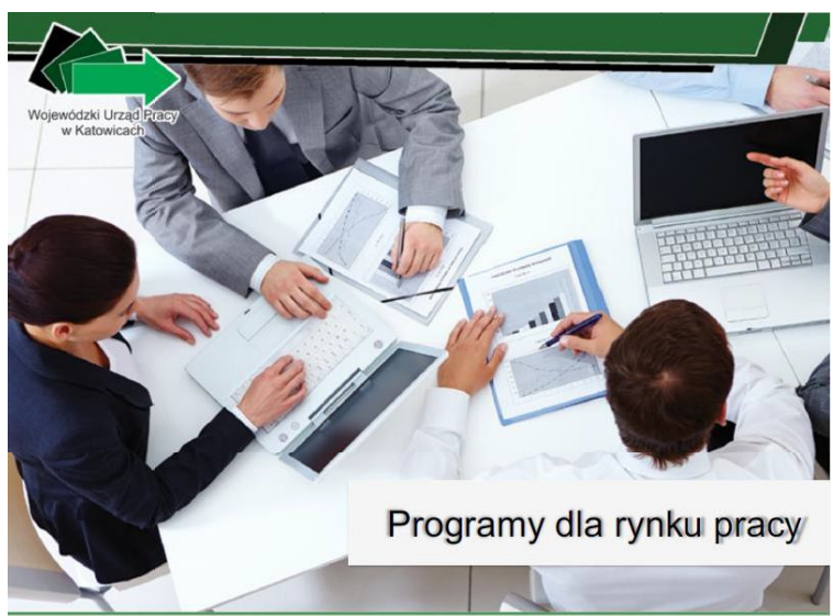
Programy dla rynku pracy